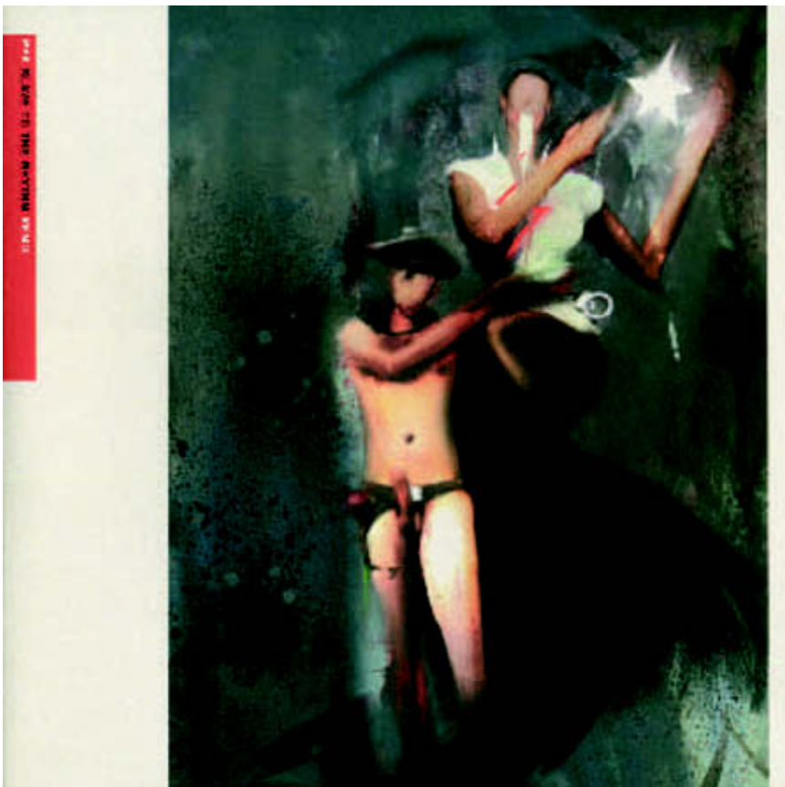
PPK: "Slave to The Rhythm," vinyl record sleeves. * Plattenhüllen. * Fundas de discos. ⤴: Eikes Grafischer Hort, Frankfurt am Main ⤵: Eike König, Ralf Hiemisch Ⓞ: Ralf Hiemisch Ⓜ: Polydor Zeitgeist