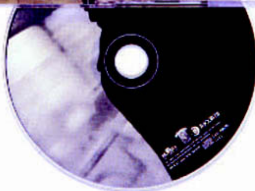
Daniele Silvestri: "Sig. Dapatas," front and back cover of CD, inside of CD case and CD. * Vorder- und Rückseite der CD, Innenansicht der CD-Hülle und CD. * Portada y contraportada del CD, interior del estuche del CD y CD. ∞: Infinite Studio, Savona, Italy ∞: Fablo Berruti ∞: Luciano Uiti ∞: BMG